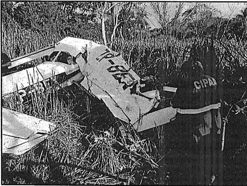
Fotografía de la aeronave accidentada

CENTRO DE INVESTIGACION Y PREVENCIÓN DE ACCIDENTES AERONAUTICOS