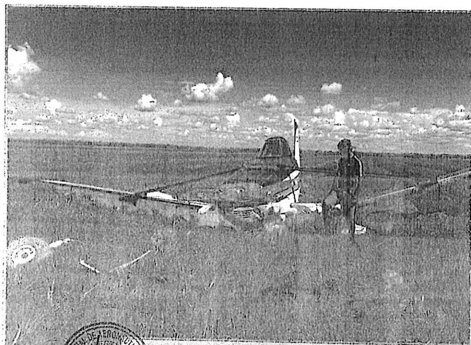
Fotografía de la aeronave accidentada

CENTRO DE INVESTIGACION Y PREVENCIÓN DE ACCIDENTES AERONAUTICOS